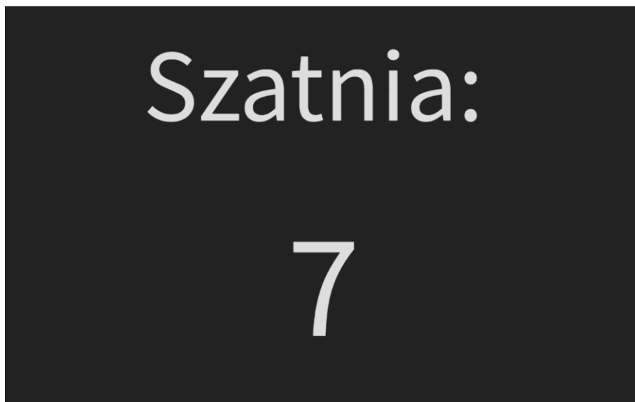
Rys. 3 Widok aplikacji RACS Display z aktywną opcją Prefix.

Funkcją programu jest wyświetlenie ilości osób przebywających w Strefie obecności. Strefy obecności definiuje się w programie VISO. W konfiguracji Strefy obecności określa się listę wejściowych i wyjściowych Punktów logowania. Osoba, która zaloguje się na wejściowym Punkcie logowania jest uznawana, jako osoba przebywająca w strefie. Osoba, która zaloguje się na wyjściowym Punkcie logowania jest uznawana, jako osoba, która opuściła strefę. Jeden i ten sam Punk logowania może występować w definicji wielu Strefach obecności, przy czym w zależności od strefy może być punktem wejściowym lub punktem wyjściowym.